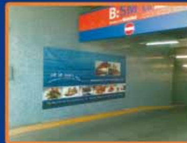
Entrades i sortides vehicles

Si desitges informació 93 534 34 43 info@vepublicidadbcn.com